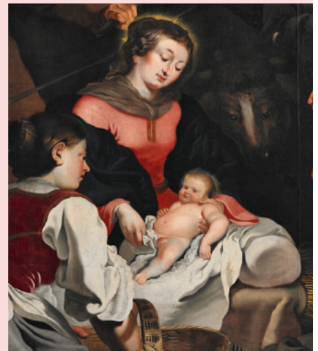
Anbetung der Hirten, Pfarrkirche Eggenburg