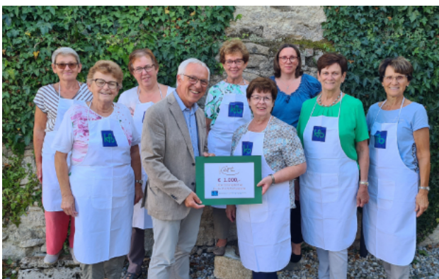
Spendenübergabe im Pfarrhofgarten

Das gemeinsame Gebet ist Ausdruck für den eigenen Glauben, für die Verbindung mit den Mitmenschen und mit Gott. Danke für das Gebet.