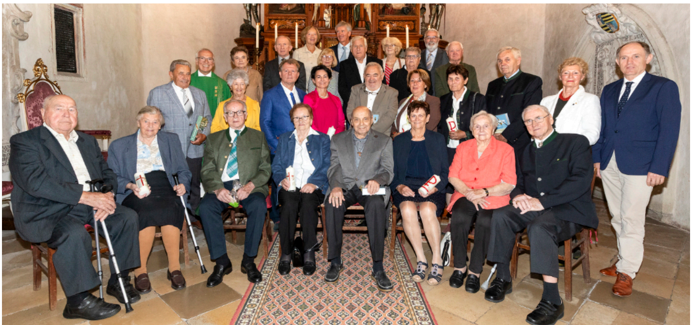
Die heurigen Jubelpaare der Pfarren Eggenburg, Kattau und Roggendorf: