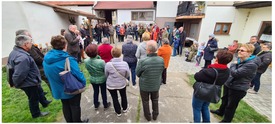
„4 Plätze - 4 Schätze“ in Roggendorf