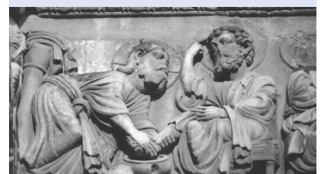
Petrus „wundert“ sich über Jesus. Relief aus Saint Gilles (Frankreich)