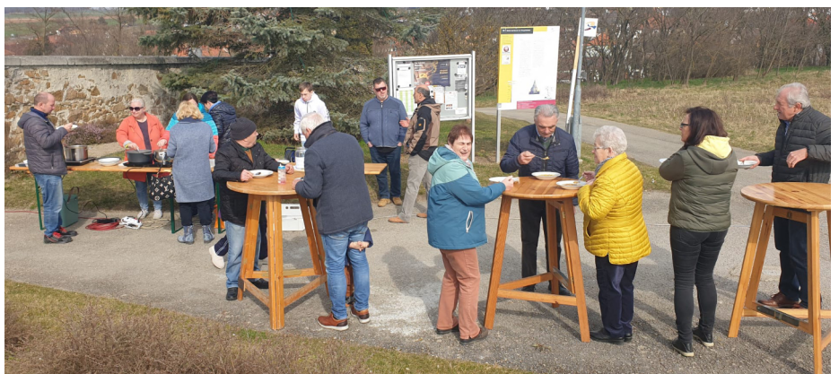
Fastensuppenessen nach dem Gottesdienst am 4. Fastensonntag in Burgschleinitz