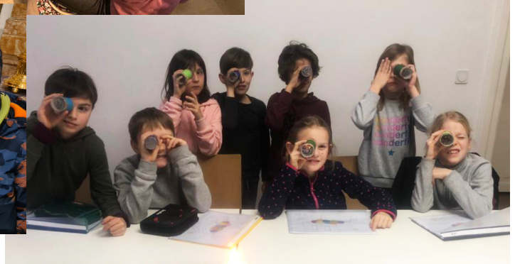
Wir sind gemeinsam auf Entdeckungsreise und wollen in der Vorbereitungszeit den Schatz Jesus näher kennen lernen.

Viele Jahre unterstütze und begleite ich nun schon Tischmütter bzw. Eltern bei der Vorbereitung ihrer Kinder auf die Erstkommunion. Manches ist während dieser Zeit anders geworden, aber eines ist gleich geblieben: Die Begegnungen mit jungen Eltern und Familien, durch die nicht selten interessante Gespräche entstehen. Zum Beispiel erzählten einige Tisch-